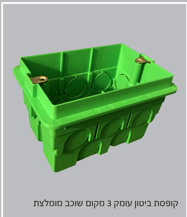
קופסת ביטון עומק 3 מקום שוכב מומלצת